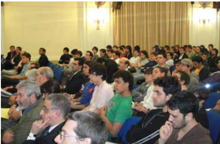
Vista de los principales asistentes