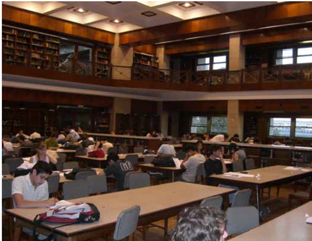
Vista parcial de la Biblioteca, donde ya se pueden consultar los 4 Handbooks de ASHRAE, donados a la Facultad de Ingeniería.